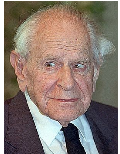
Karl Popper (1902-1994)