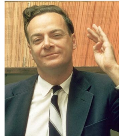
Richard Feynman (1918–1988)

Dunque lo sguardo scientifico sul mondo osserva la realtà, ma al tempo stesso fa molta astrazione dalla realtà e nella realtà. Uno dei prodotti di questa astrazione è l'individuazione, «estrazione», «distillazione», dalla realtà complessa, di alcune grandezze fisiche, pronte per essere misurate, cioè tradotte in numeri.